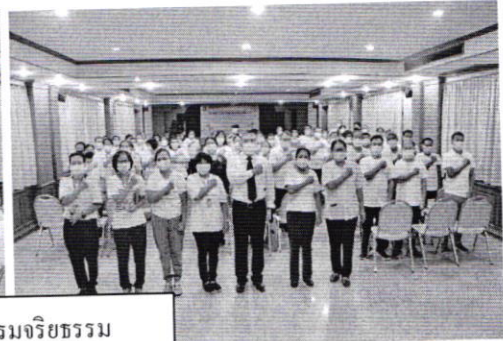
อบรมจริยธรรม