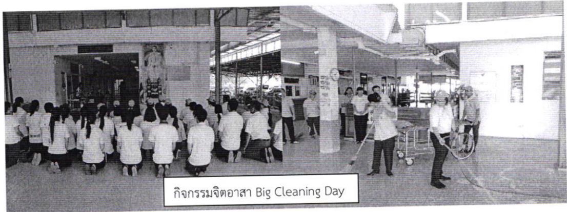
กิจกรรมจิตอาสา Big Cleaning Day