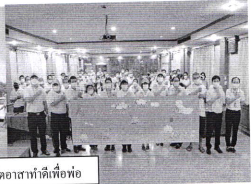
โครงการจิตอาสาทำดีเพื่อพ่อ